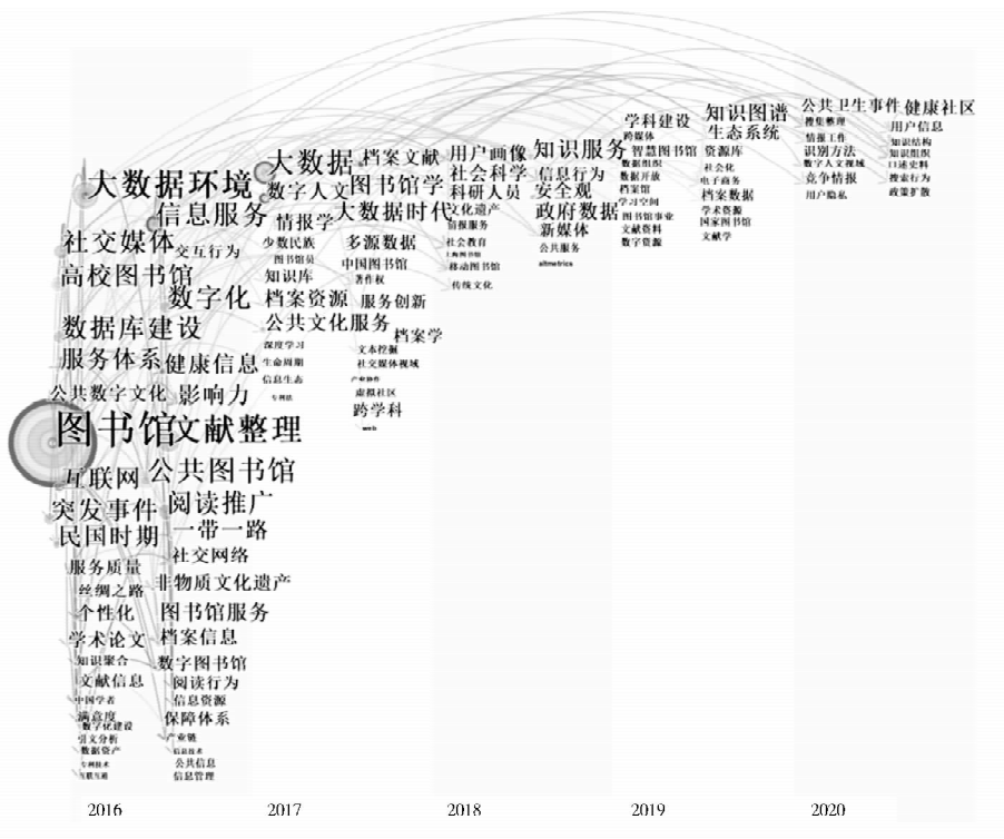
图 4 图情档学科国家社科基金项目历年关键词时区

增长,而多维度、针对性地刻画用户画像是分析用户的信息行为和实际需求的有效途径,将此技术和方法引入图书馆知识服务体系中,不仅有利于高效精准地提高知识服务质量,还将改进服务模式,提高用户对图书馆服务的认可度。“开放”“政府”“数据”的共现体现了开放数据对政府工作改革、公众的生产社会生活的重要作用。开放政府数据是近年来国内外电子政务和信息管理领域的热点研究方向。政府所采集和保存的数据与公众的生产社会生活息息相关。在大数据时代,政府向社会公众开放其所拥有的数据,供社会进行增值利用和创新应用,将创造巨大的公共价值,推动经济增长和社会发展 [19] 。 “知识图谱”“生态系统”“学科建设”出现在 2019 年。“知识图谱”代表了信息时代的前沿技术与信息用户行为研究领域,而各类学科的知识系统都具有多样性、生态性的特征,内部知识既相互依存又相互支撑。审视和推进学科生态系统,既能体现学科发展的动态路径,也是学科建设的需要。 “健康社区”“公共卫生事件”“用户信息”等词出现在 2020 年,COVID-19 疫情这一突发的公共卫生事件使得“公共卫生事件”高频出现。“健康”在图情档学科中往往存在于“网络健康”“网络生态健康”“健康信息系统”等研究中 [20] ,这体现了信息生态学、网络健